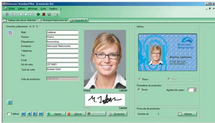
EDISecure® CMS Standard Plus