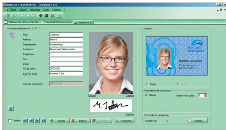
EDIsecure® CMS Standard Plus