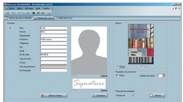
EDIsecure® CMS Standard Plus